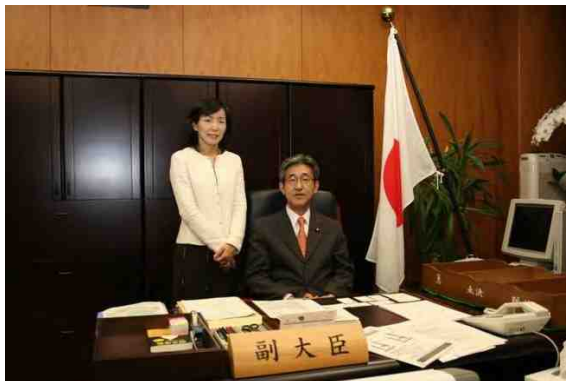
副大臣室にて夫人と(写真右)

去る11月2日、農林水産副大臣を拝命致しました。もとよりご支持、ご支援いただいております皆様のおかげでございます。この場をかりて御礼申し上げます。