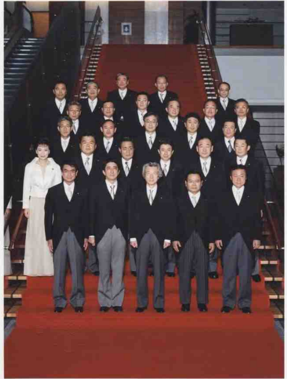
「副大臣認証官任命式」後の、総理官邸記念撮影(写真上)