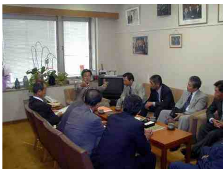
議員会館にて地元の皆様の陳情に熱心に耳を傾ける (写真は球磨郡山江村議会の皆様)