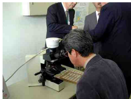
10月11・12日 参院農水委員会でBSE問題に関する視察(千葉県庁、茨城県配合飼料工場、など) (上:茨城県つくば市、動物衛生検査所にて、顕微鏡でプリオンを覗く)