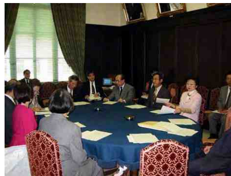
予算の衆議院、決算の参議院と言われる決算委員会の理事として理事会に出席