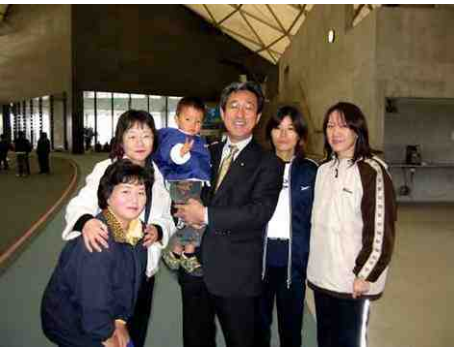
12月14日、パークドーム熊本にて秋の運動会 に参加して (ひのくにたばこフェスタ)