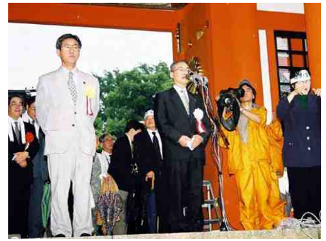
7月12日、藤崎八幡宮 出陣式にて