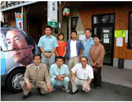
8月31日、選挙で大活躍した小泉総裁の似顔絵 入り広報車の前で記念撮影 (JA阿蘇久木野中央支所にて)