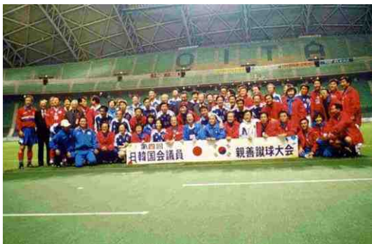
11月17日、日韓国會議員親善サッカー大会に参加して (2-3と惜敗し、本年済州島でのリベンジを誓う)