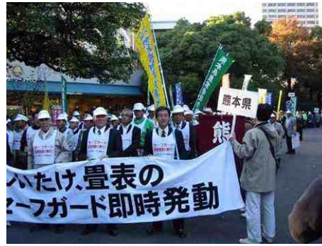
11月16日、セーフガード本発動実現全国総決 起大会終了後、地元JAの皆さんとセーフガード 本発動要請デモに参加