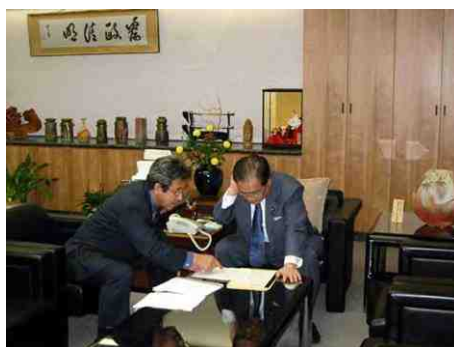
多忙な総務大臣をつかまえ、地元熊本の実情について力説