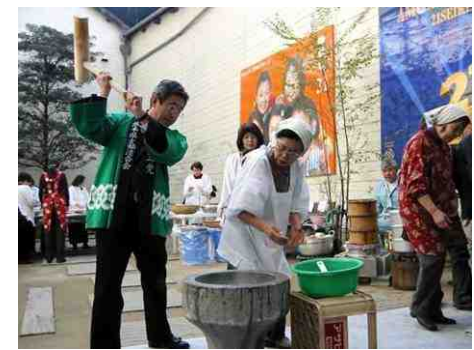
12月8日、熊本市下通りにて、 県連主催チャリティー餅つき大会