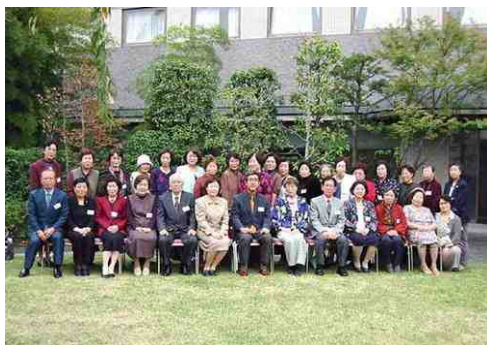
10月27日、三浦議員を囲む女性の会にて、教育問題についての国政報告を行う