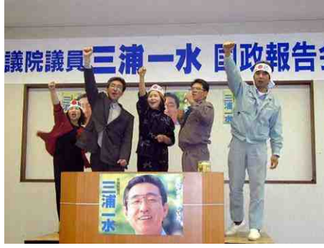
5月1日、玉名郡市国政報告会