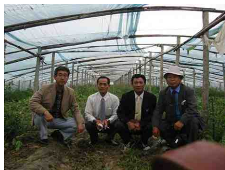
9月19・20日、中国一の野菜産地、山東省へ敵状視察 左写真、山東市場にて、シントウガラシ荷下し 右写真、スイカハウスにて