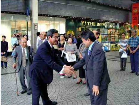
5月27日、熊本市下通りにて、 全国統一斉遊説