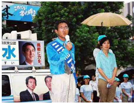
7月28日、熊本市辛島公園にて、 雨の中での街頭演説